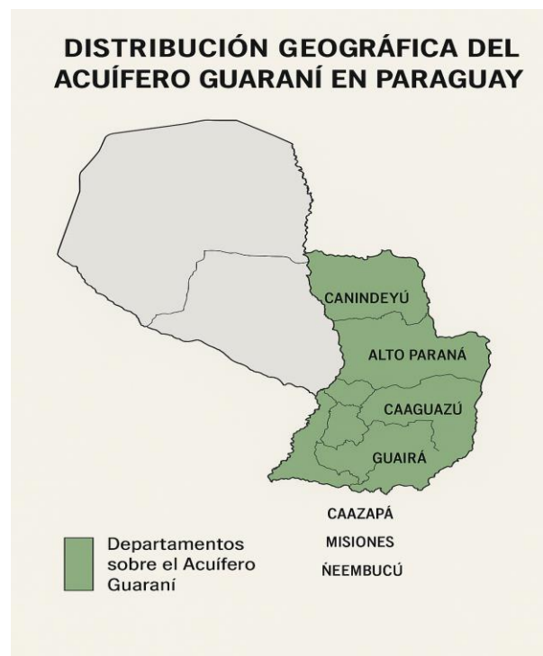
Figura 1. Distribución del Acuífero Guaraní en Paraguay. Distribución geográfica del Acuífero Guaraní en Paraguay. Adaptado de BGR & SEAM (2007).

El Sistema Acuífero Guaraní se extiende en el territorio paraguayo, especialmente en la Región Oriental, abarcando los departamentos de Itapúa, Alto Paraná, Canindeyú, Caaguazú, Guairá, Caazapá y Misiones, siendo los departamentos de Caaguazú y Alto Paraná las zonas de recarga más activas.